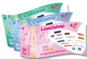
Talebau siopau'r stryd fawr Love2shop

Os byddwch yn cymryd rhan mewn cyfweliad neu grŵp ffocws, byddwch yn cael taleb gwerth £15 bob tro. Cewch ddewis naill ai dalebau siopau'r stryd fawr neu dalebau iTunes©.